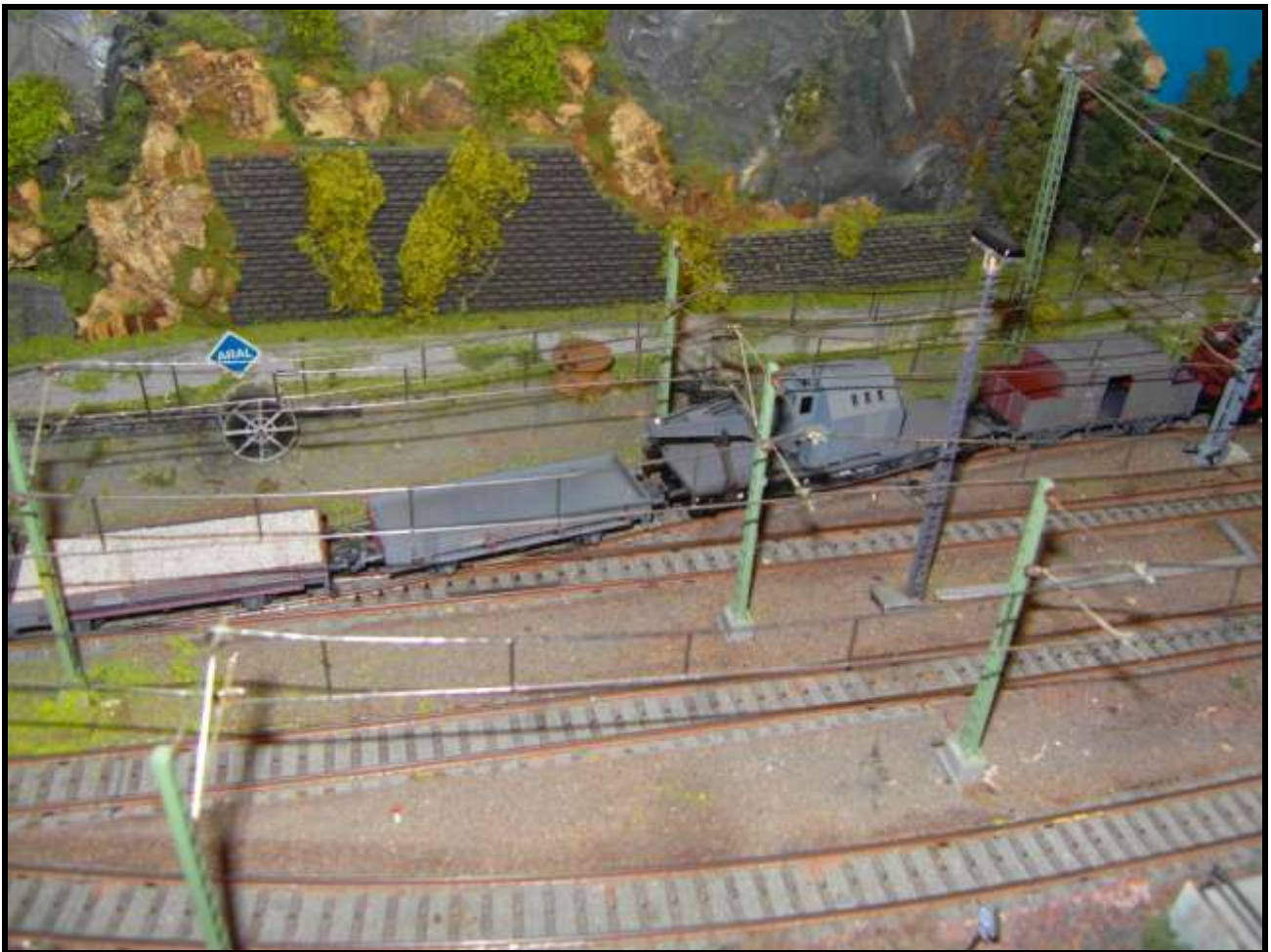
Foto n. 16: un convoglio con una gru ambientabile nel 1935 a Vibaden