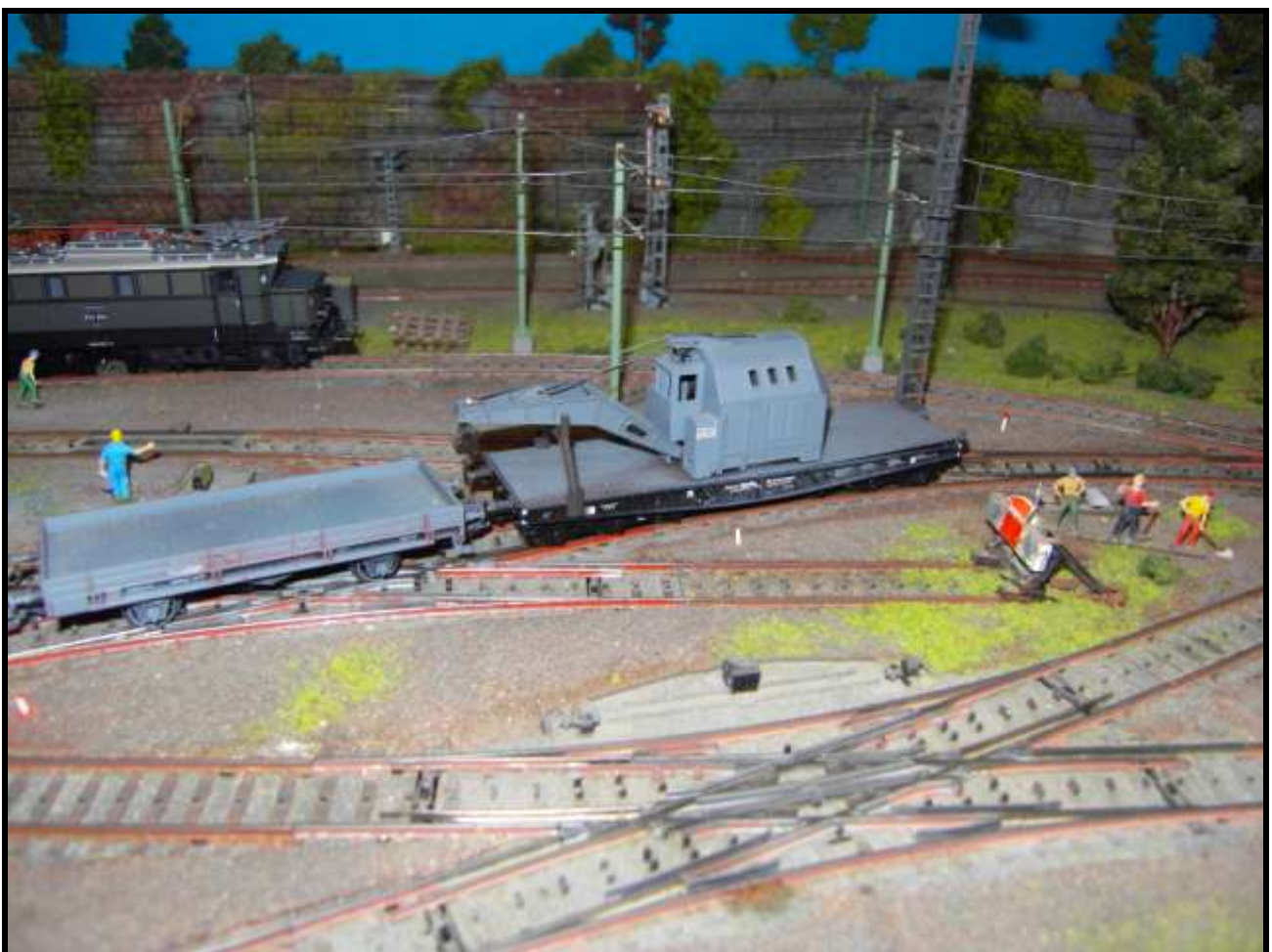
Foto n. 19: particolare della gru con un carro di servizio a Vibaden