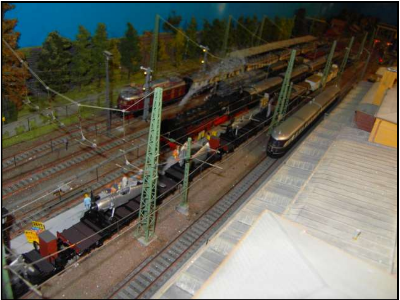
Foto n. 11: Br 39 048 con carrozze tipo "Hecte" nel 1940 a Vibaden