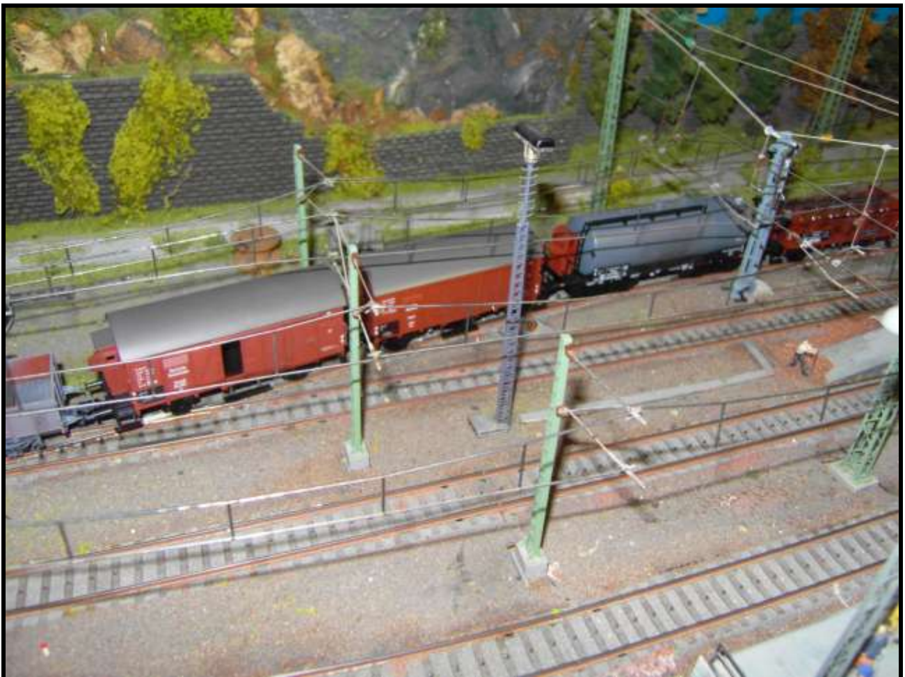
Foto n. 17: carri Oppeln, cisterna e porta acidi nel 1936 a Vibaden