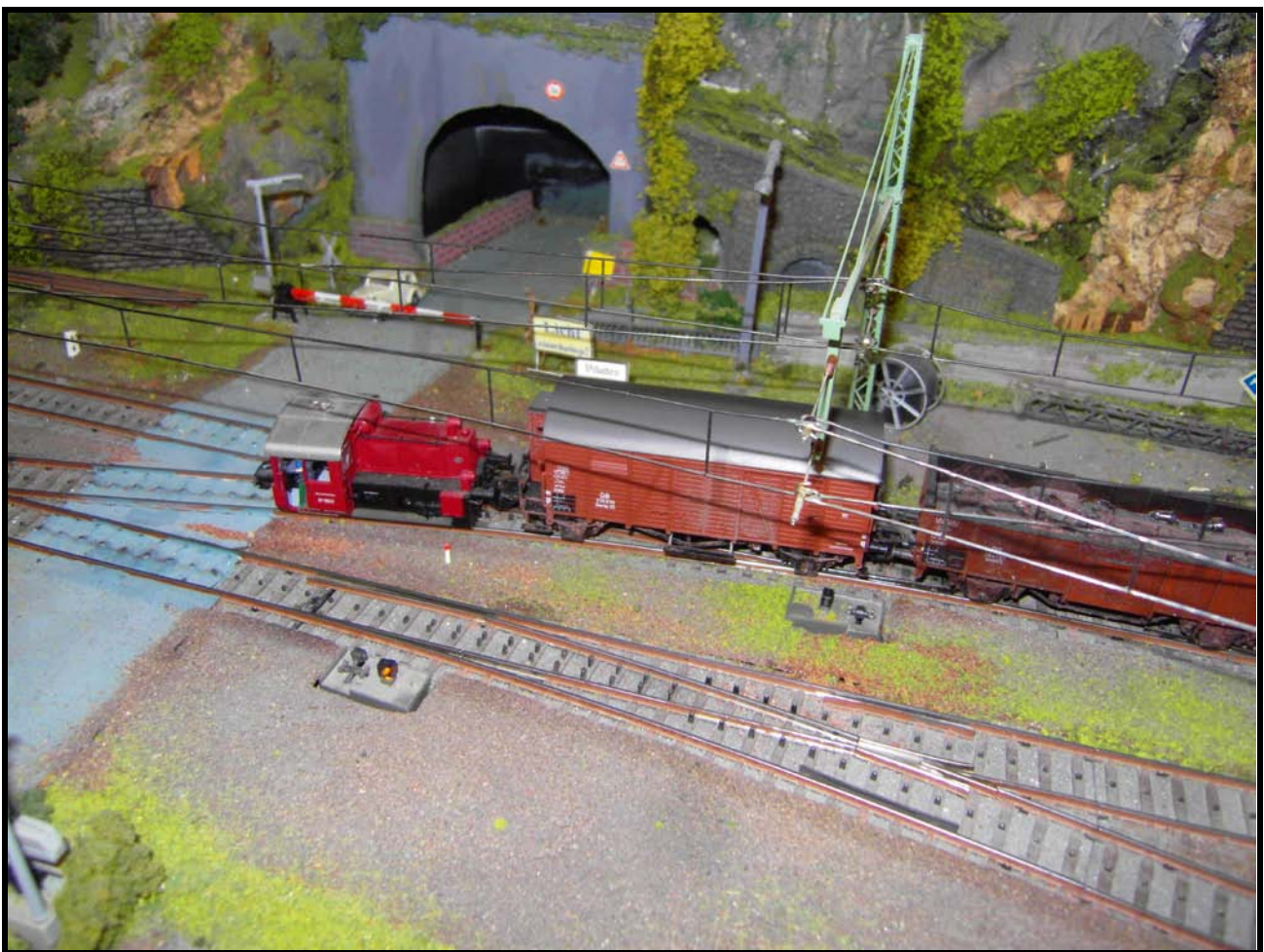
Foto n. 10: il Köf II 6641, traina due carri dal binario 3 allo scalo merci.