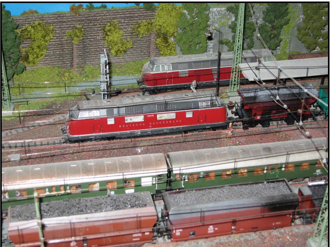
Foto n. 4: nei binari 5° e 6° della stazione di Vibaden in primo piano una V 200 073 Roco, sullo sfondo una V 200 150 Märklin

Arrivano nel 1965 anche i prototipi delle E 03, nella foto n. 6 la E 03 001 ( art. 37575 ) e al centro della foto n. 7 la E 03 004 ( art. 39573 ), con il suo convoglio di carrozze TEE rosso crema con la immancabile vettura panoramica con cupola trasparente.