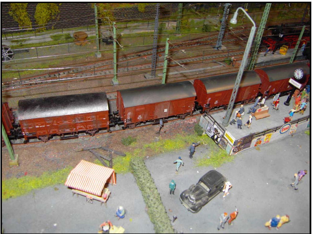
Foto n. 14 : i carri O-peln, invecchiati singolarmente, in stazione.