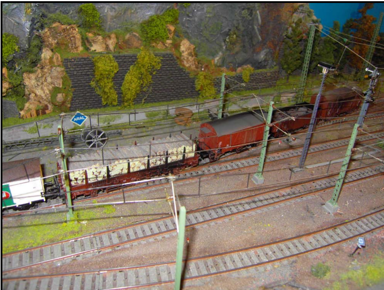
Foto n. 22: carri Persil, legname, Oppeln, rottami e un Gs in coda.