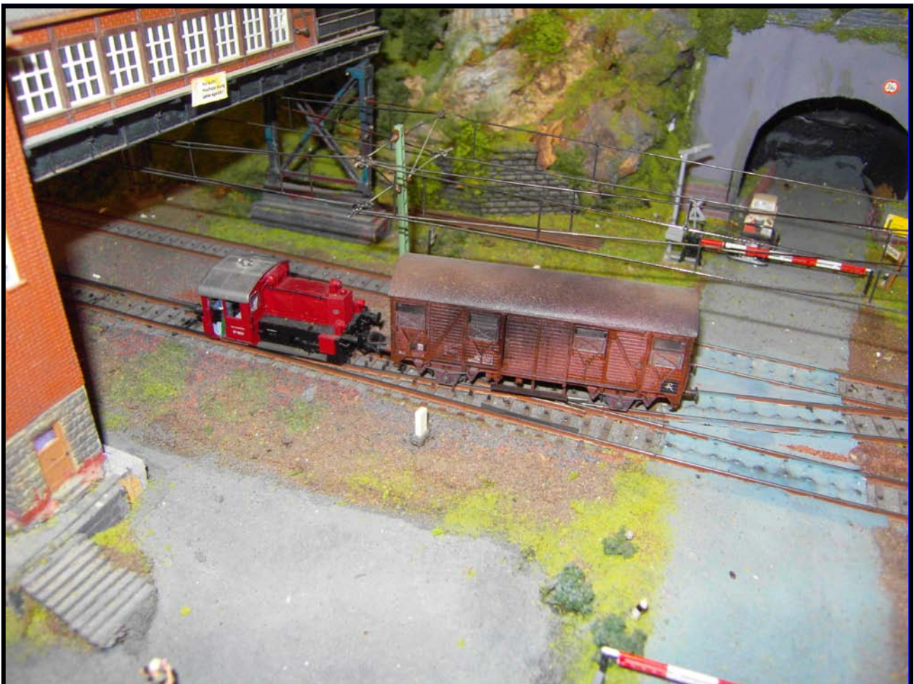
Foto n. 11 : dallo scalo merci un carro per il Köf II da portare ai binari.