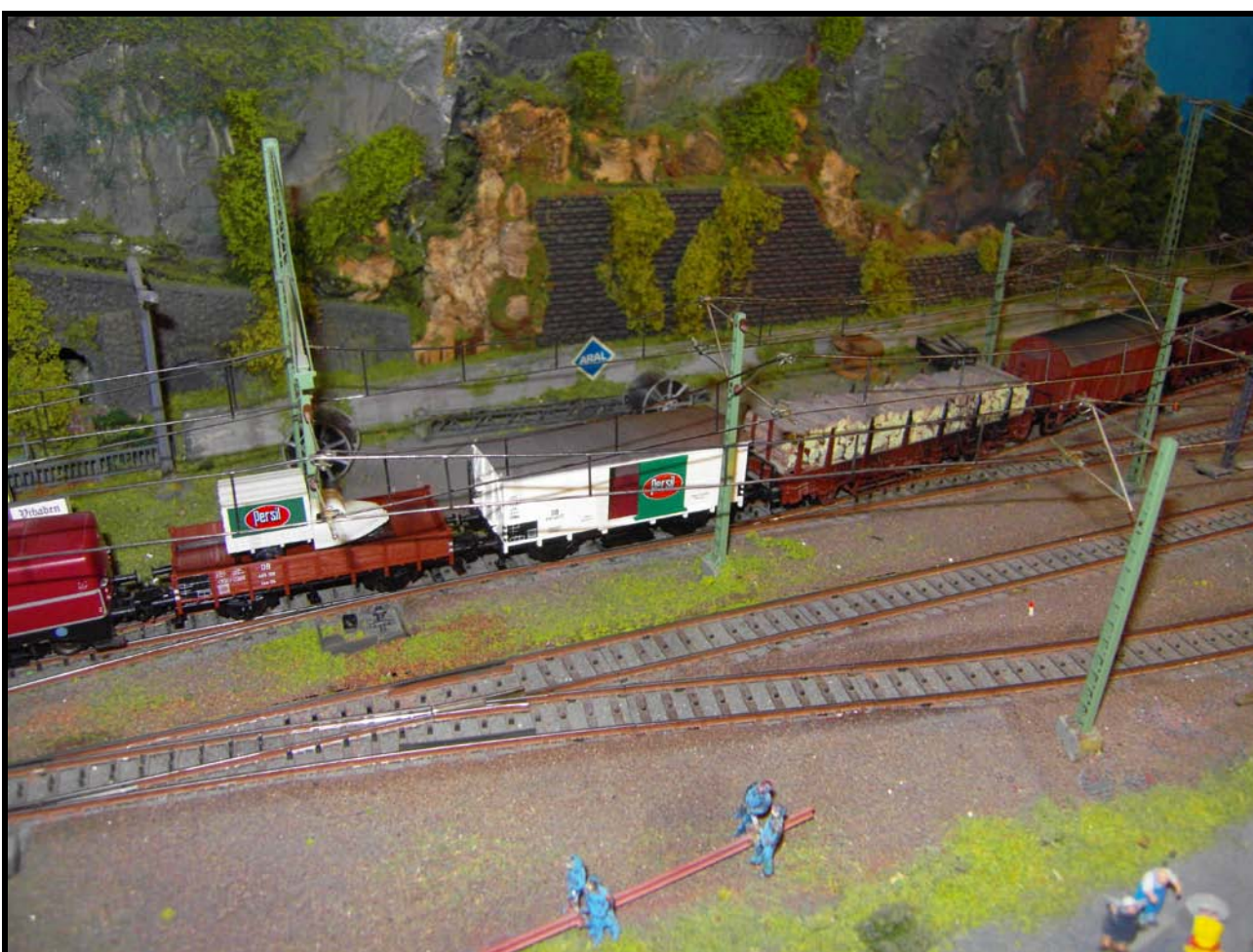
Foto n. 21: il convoglio "raccogliitore" trainato dalla V 80 004.