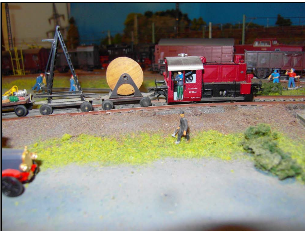
Foto n. 8: un Köf II traina dei carrellini di servizio per la linea aerea.