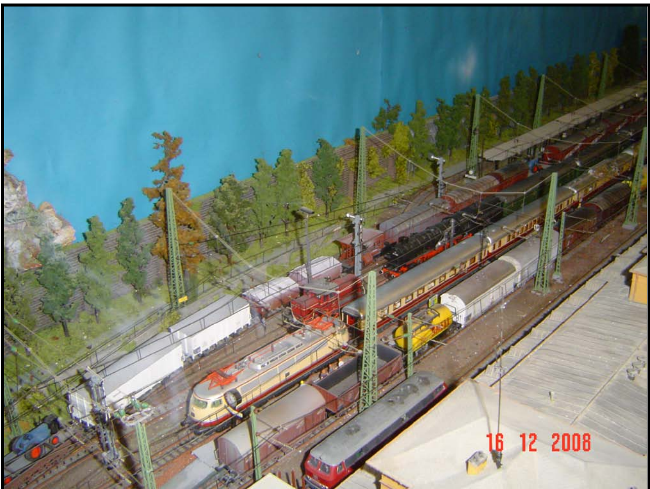
Foto n. 7: la stazione di Vibaden nel 1965, sul 3° binario la E 03 004.