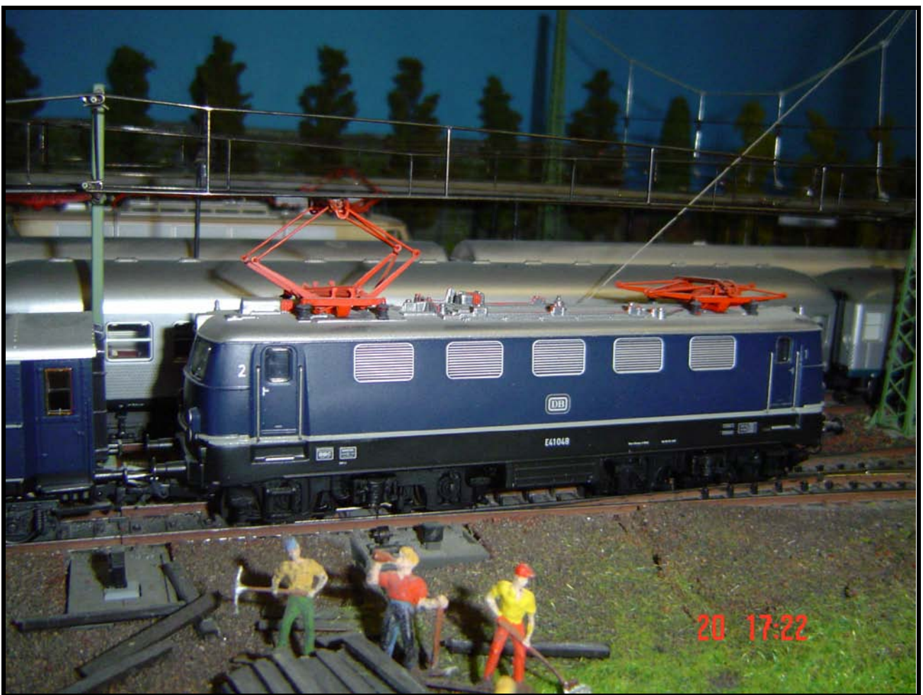
Foto n. 2: una E 41 in azzurro, vecchio modello del 2000, a Vibaden.