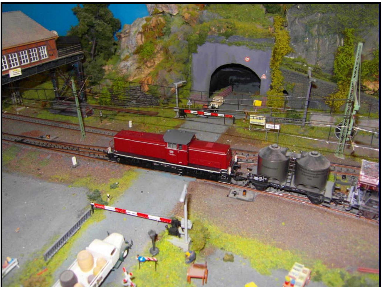
Foto n. 25 : nel 1964 arrivano le diesel da manovra pesante V 90.