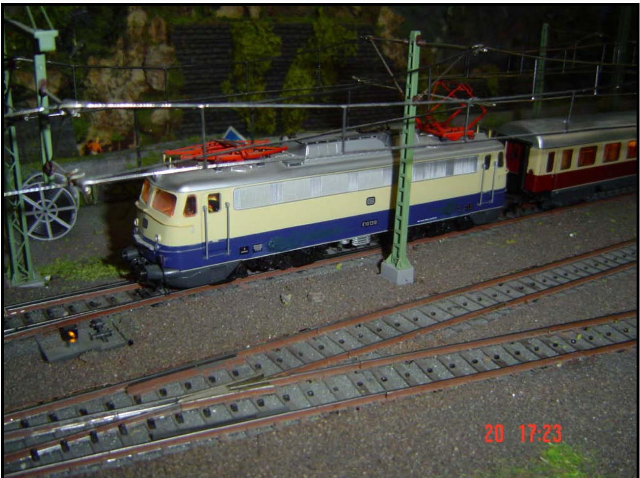
Foto n. 3: la E 10 1310 (ex Liliput, con telaio e nuovi pantografi Märklin) con il corrimano sotto i finestrini anteriori.